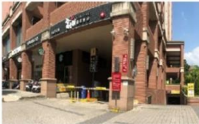
汽車停車場出口及機車停車場出入口 位於勝利路星巴克旁