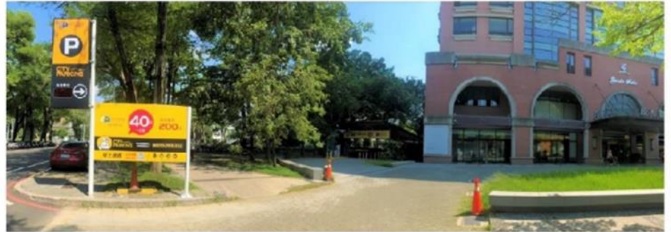
汽車停車場入口位於正門左側五公尺處